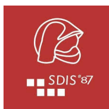
Service départemental d'incendie et de secours (SDIS) 87

La classe défense s'appuie non seulement sur une équipe pédagogique engagée mais aussi et surtout sur plusieurs partenaires :