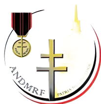
Association Nationale des Descendants des Médailleurs de la Résistance Française (ANDMRF)