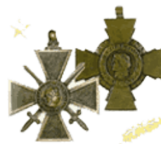
Association nationale des croix de guerre et de la valeur militaire